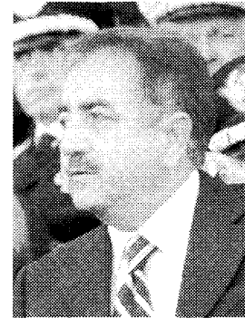
Sen. Lorenzo Forcieri

R IVA TRIGOSO - Sul Programma Fremm il Sottosegretario alla Difesa, senatore Lorenzo Forcieri, vuole intervenire, anche a nome del Governo difendendo il Ministro della Difesa, per fornire spiegazioni sull'andamento delle trattative e, quindi, della possibilità di altre commesse navali che interessano direttamente La Fincantieri di Riva Trigoso.